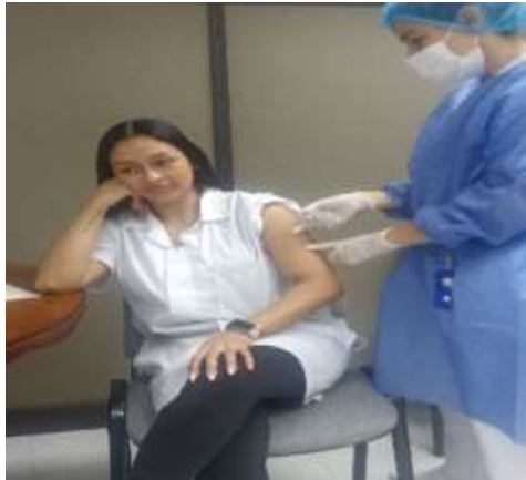
Jornada de Vacunación Empresarial Persianas Panorama

En la Comunidad Pasionista ubicada en el barrio las Brisas se aplicaron un total de 60 vacunas de Influenza entre adultos mayores de 60 años